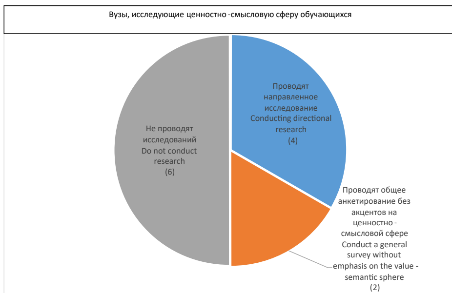
Рис. 3. Количественные данные по вузам, исследующим ценностно-смысловую сферу обучающихся

Исследование содержания программ воспитания на предмет наличия инструментов исследования социокультурной идентичности субъектов воспитательной деятельности показало, что в половине вузов не предусмотрены процедуры получения данных о социокультурных характеристиках субъектов воспитательной деятельности. Из этого следует вполне закономерный вывод об отсутствии в этих вузах обоснованных представлений о том, с какими культурными образцами соотносят себя обучающиеся, обучающие, организаторы воспитательной работы и др.