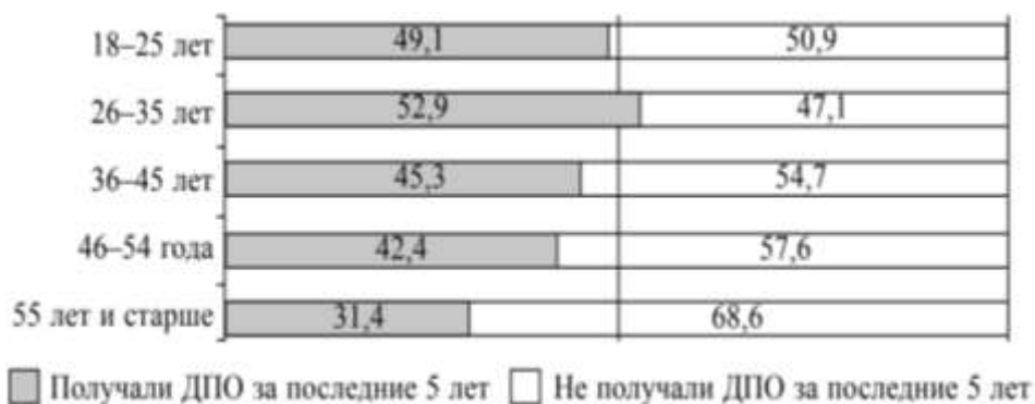
Рисунок 2 - Доля населения, включенная в систему дополнительного образования в России на начало 2018 г., процент от работающего населения

Текст ВКР. Текст ВКР. Текст ВКР. Текст ВКР. Текст ВКР. Текст ВКР. Текст ВКР. Текст ВКР. Текст ВКР. Текст ВКР. Текст ВКР. Текст ВКР. Текст ВКР. Текст ВКР. Текст ВКР. Текст ВКР. Текст ВКР. Текст ВКР (рисунок 2).