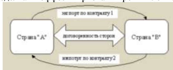
Рис. 1. Схема «оффсет»

Важной особенностью сделок «оффсет» является то, что в их рамках предполагается не только обусловленный неформализованной договоренностью сторон обмен товарами и услугами, но и предоставление импортеру по основному контракту возможности инвестировать капитал в ожидании получения от экспортера различного рода услуг и льгот (рис. 1). Все это придает сделкам «оффсет» признаки промышленной кооперации сторон.