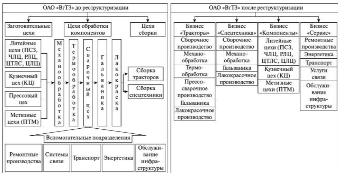
Рис. Структура ОАО «Волгоградский тракторный завод» до и после реструктуризации

Завод производил полуфабрикаты, предназначенные для монтажа в новостройках. Технологический процесс построен на основе трех производственных линий. Завод выпускал следующие виды продукции.